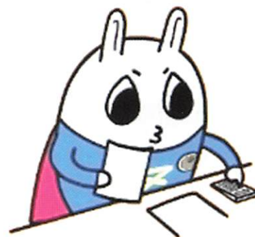
東京地方税理士会 イメージキャラクターの「トッチーくん」